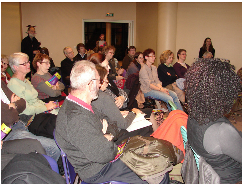
Le public à la médiathèque d'Épernay lors de la rencontre avec Fatou Diome