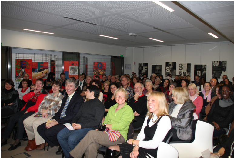
Le public à la médiathèque de Cormontreuil lors de la rencontre avec Ken Bugul