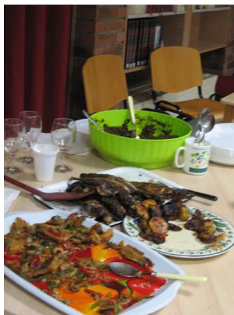
Buffet congolais à la médiathèque Laon-Zola de Reims

Directrice de la publication : Delphine Quéreux-Sbaï - Conception et réalisation : Virginie Leducq Rédaction : Delphine Henry et Virginie Leducq - Relecture : Delphine Quéreux-Sbaï et Éléonore Debar. Dépôt légal : janvier 2010 - ISSN 0768-5742