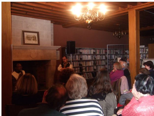
Abdhouraman A. Waberi à la bibliothèque de Saint-André-les-Vergers