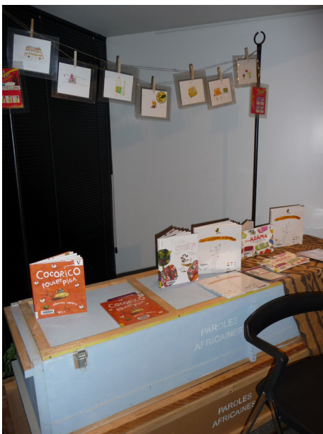
Présentation de livres jeunesse sur l'Afrique à la médiathèque Croix-Rouge de Reims