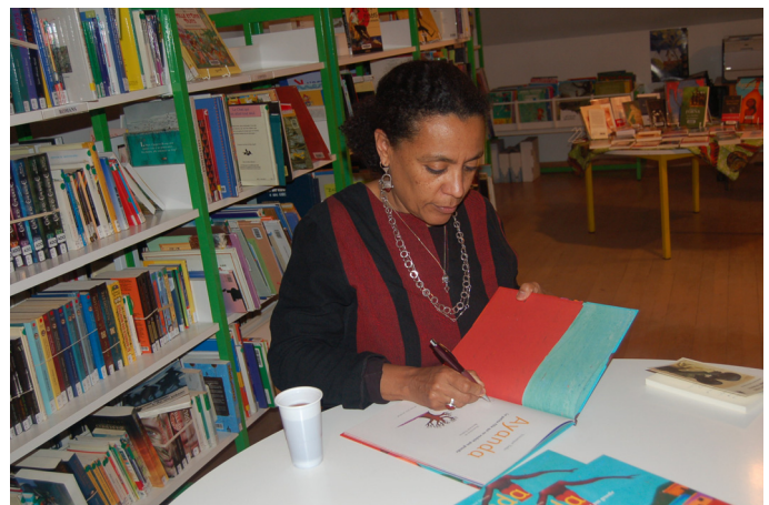
Véronique Tadjo en dédicace à la médiathèque d'Auberive