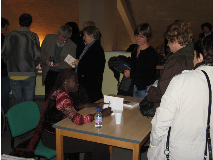
Ken Bugul à la bibliothèque de Vouziers