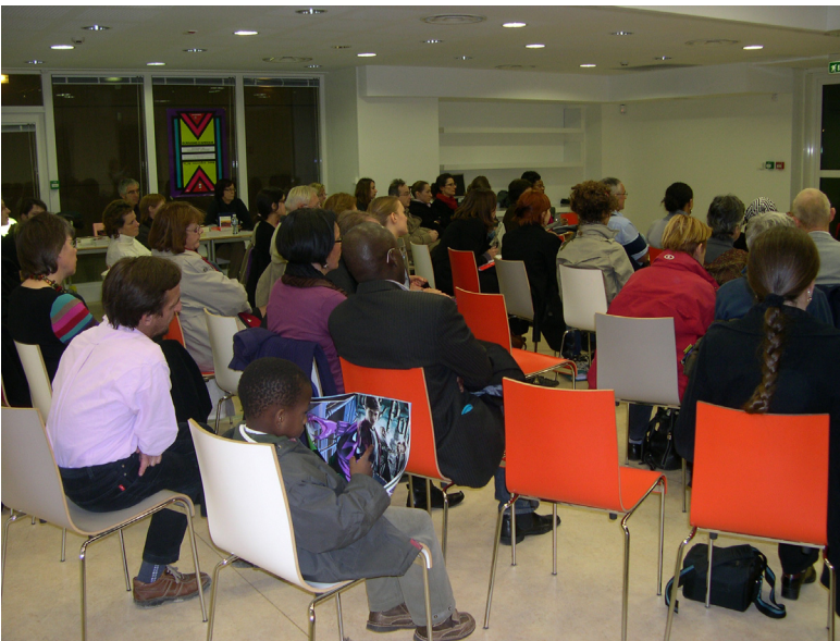
Le public à la bibliothèque universitaire Robert de Sorbon à Reims lors de la rencontre avec André Brink