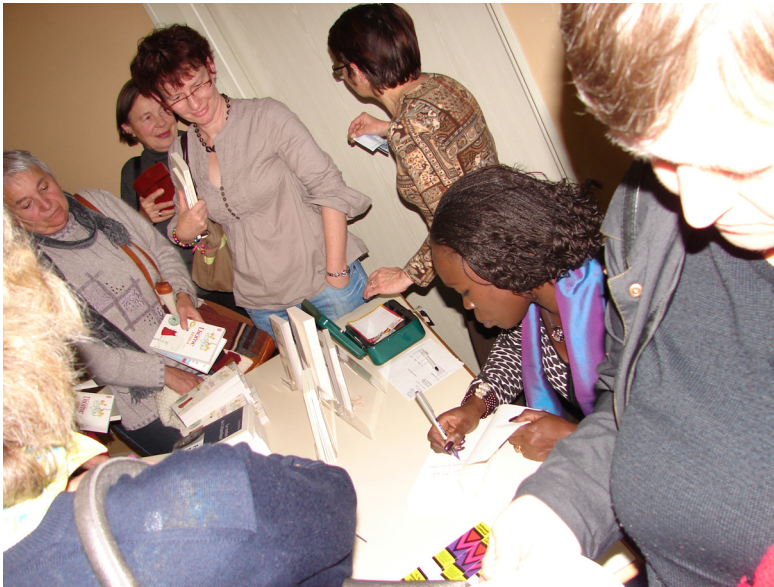
Fatou Diome en dédicace à la médiathèque d'Épernay

C'est au moins 600 livres qui ont été vendus à l'occasion des rencontres, la vente étant suivie de dédicaces qui ont permis au public d'approcher les auteurs pour un échange privilégié. Certaines ont duré plus d'une heure !